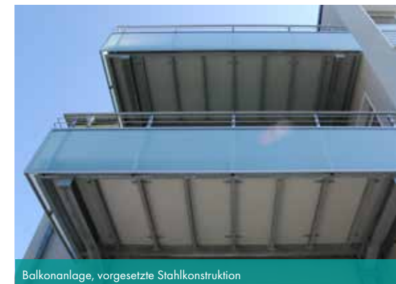
Balkonanlage, vorgesetzte Stahlkonstruktion