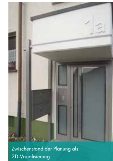
Zwischenstand der Planung als 2D-Visualisierung