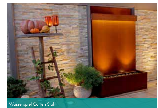
Wasserspiel Corten Stahl