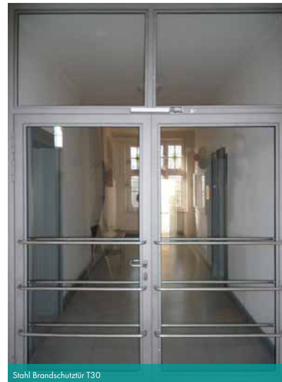
Stahl Brandschutztür T30