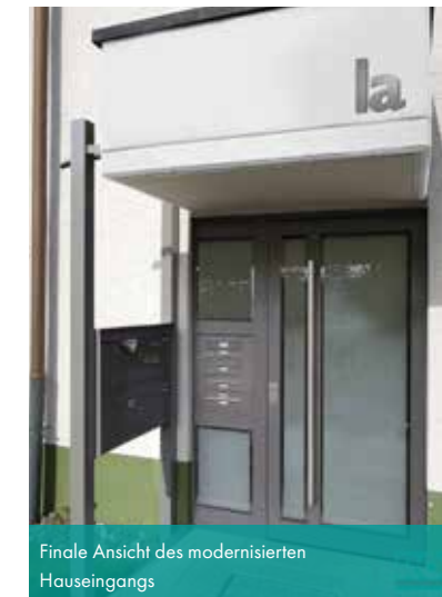
Finale Ansicht des modernisierten Hauseingangs