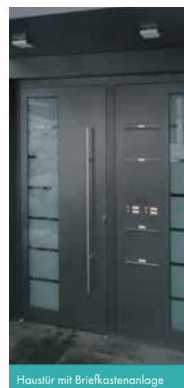
Haustür mit Briefkastenanlage