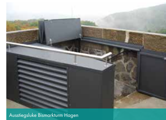
Ausstiegsluke Bismarkturm Hagen

Ob ausgefallenes Firmenschild, Pavillon, Spezialleuchte oder individuelle Verkleidung – in enger Abstimmung mit unseren Kunden realisieren wir maßgefertigte Werkstücke.